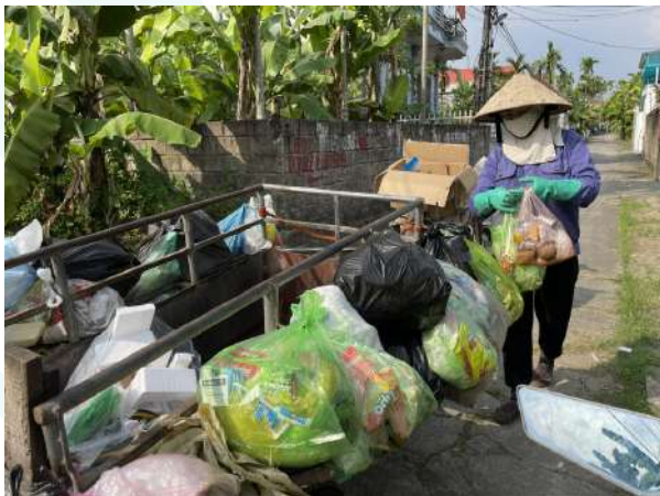
Hình ảnh Công nhân thu gom rác bằng xe tự chế

Khảo sát Nhận thức - Thái độ - Hành vi (KAP) với 205 hộ gia đình tại toàn bộ 4 thôn của xã Lâm Động và các nguồn rác chính giúp xác định nhận thức - thái độ - hành vi của người dân địa phương với vấn đề rác thải, từ đó đề xuất các giải pháp nâng cao nhận thức và cải thiện hệ thống quản lý rác thải tại địa phương.