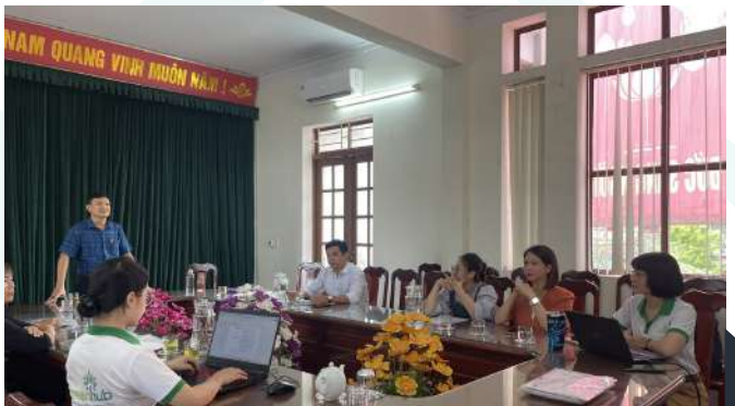
Cuộc họp Thống nhất kế hoạch thực hiện Hoạt động khảo sát đầu dự án ngày 30/10/2023