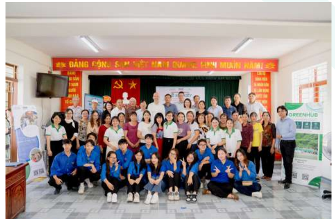
Toàn cảnh Lễ khởi động dự án

Trong sáng cùng ngày, Lễ ký kết Biên bản Ghi nhớ Hợp tác giữa Công ty TNHH đóng tàu Damen Sông Cấm (DSCS), Trung tâm Hỗ trợ Phát triển Xanh (GreenHub) và Ủy ban Nhân dân xã Lâm Động được thực hiện là dấu mốc quan trọng trong mối quan hệ hợp tác ba bên, đảm bảo mục tiêu và 4 hợp phần của dự án được thực hiện xuyên suốt và hiệu quả.