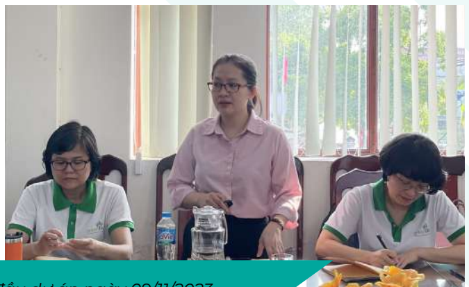
Chia sẻ kết quả Báo cáo sơ bộ Hoạt động khảo sát đầu dự án ngày 09/11/2023