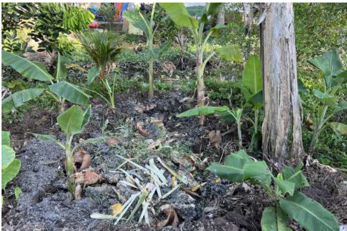
Hình ảnh Mô hình Vòng tròn chuối tại Côn Sơn, Cần Thơ

Song song với hoạt động truyền thông nâng cao nhận thức – năng lực cho địa phương thì các Mô hình thí điểm như “Làng Không rác thải”, “Mô hình phân loại rác tại chợ và Chợ không túi ni lông”, “Mô hình Vòng tròn chuối” tại một số hộ dân có diện tích đất vườn lớn... sẽ được GreenHub lên kế hoạch cùng chính quyền địa phương, các hội đoàn thể và sự tham gia của nhóm thu gom chất thải nhằm xác định tính khả thi và thí điểm thực hiện.