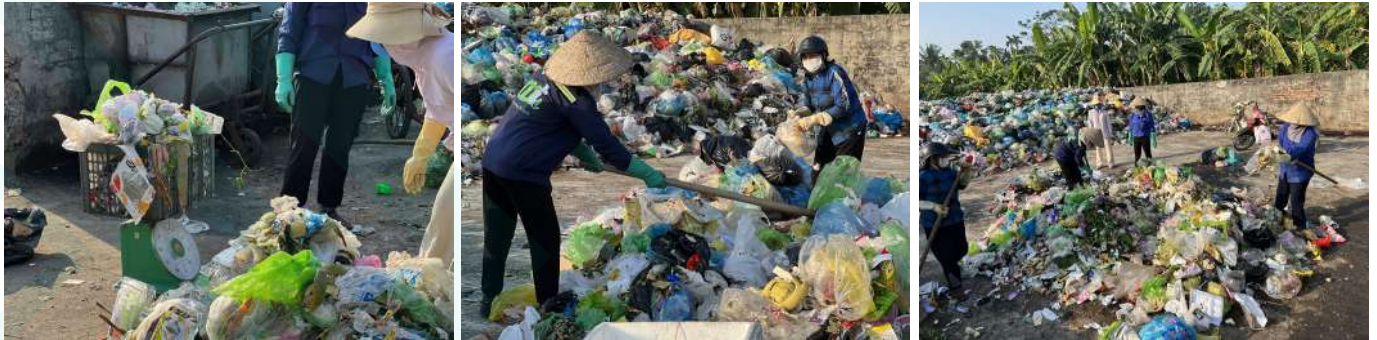
Kiểm đếm rác tại ga rác

Phòng vấn sâu với đại diện các bên liên quan giúp khảo sát có được những thông tin tổng quát và số liệu đầy đủ hơn trên nhiều góc độ và vị trí khác nhau trong chuỗi quản lý rác thải tại xã Lâm Động.