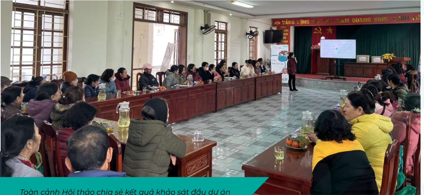
Toàn cảnh Hội thảo chia sẻ kết quả khảo sát đầu dự án

Ngày 20/12/2023, Hội thảo Chia sẻ Kết quả Khảo sát và Kế hoạch thực hiện năm 2024 dự án "Thí điểm mô hình kinh tế tuần hoàn trong quản lý rác thải tại xã Lâm Động" đã diễn ra tại xã Lâm Động, huyện Thủy Nguyên, thành phố Hải Phòng.