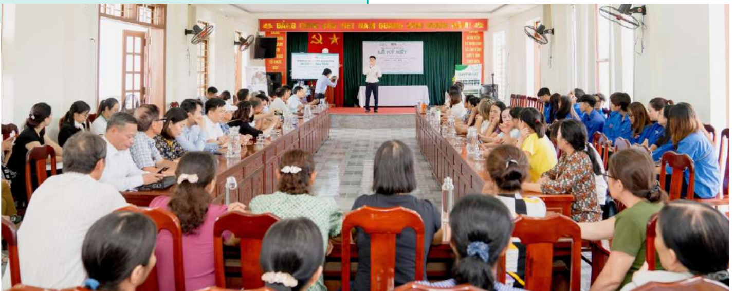
Toàn cảnh Lễ khởi động dự án

Dự kiến thực hiện từ tháng 8/2023 đến tháng 12/2024, dự án “Thí điểm mô hình kinh tế tuần hoàn trong quản lý rác thải tại xã Lâm Động” hứa hẹn một hướng đi mới trong công tác quản lý rác thải tại địa phương, góp phần giảm lượng rác thải ra bãi chôn lấp hoặc rò rỉ ra môi trường, cải thiện môi trường và đời sống người dân thông qua hợp tác công tư trong quản lý rác thải.