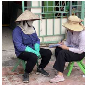
Phòng vấn sâu công nhân thu gom rác tại xã Lâm Động