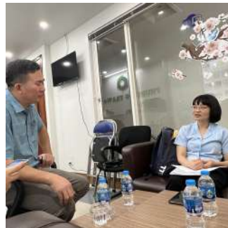
Phòng vấn sâu với Giám đốc CTCP thương mại và dịch vụ kho vận Phú Hưng