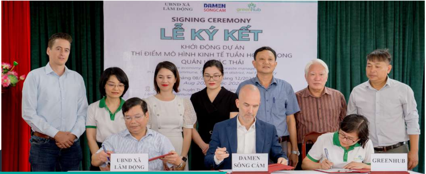
Lễ ký kết hợp tác thực hiện dự án giữa 3 bên

Ngày 23 tháng 09 năm 2023, Công ty TNHH đóng tàu Damen Sông Cấm (DSCS) phối hợp với Trung tâm Hỗ trợ Phát triển Xanh (GreenHub) và Ủy ban Nhân dân xã Lâm Động tổ chức Lễ Khởi động và Ký kết hợp tác triển khai dự án: “Thí điểm mô hình kinh tế tuần hoàn trong quản lý rác thải tại xã Lâm Động” , đánh dấu bước đầu trong nỗ lực hỗ trợ xã Lâm Động nâng cao hiệu quả quản lý rác thải tại địa phương.