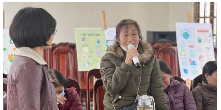
Hình ảnh người tham gia tích cực đóng góp ý kiến trong Hội thảo

Buổi hội thảo kết thúc với sự thống nhất và chung tay của UBND xã Lâm Động, cộng đồng địa phương và các đối tác liên quan nhằm thực hiện thành công kế hoạch dự án năm 2024, cải thiện hệ thống quản lý rác thải và nâng cao chất lượng cuộc sống người dân tại xã Lâm Động.