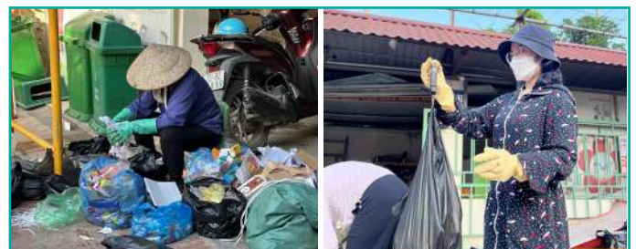
Kiểm đếm rác tại trường mầm non