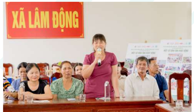
Hình ảnh người dân tham gia đóng góp ý kiến

Thông qua buổi lễ, các thông tin và kế hoạch thực hiện dự án được lan tỏa đến các cấp chính quyền, hội đoàn thể và người dân. Đồng thời, các ý kiến đóng góp từ chuyên gia môi trường, Chi cục Bảo vệ Môi trường thành phố Hải Phòng và các bên liên quan góp phần xây dựng cơ sở vững chắc cho các kế hoạch hoạt động dự án phù hợp với thực tế và nhu cầu của địa phương.