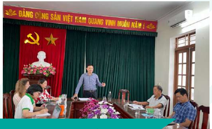
Cuộc họp xây dựng kế hoạch và thống nhất các hợp phần dự án vào tháng 8/2023.