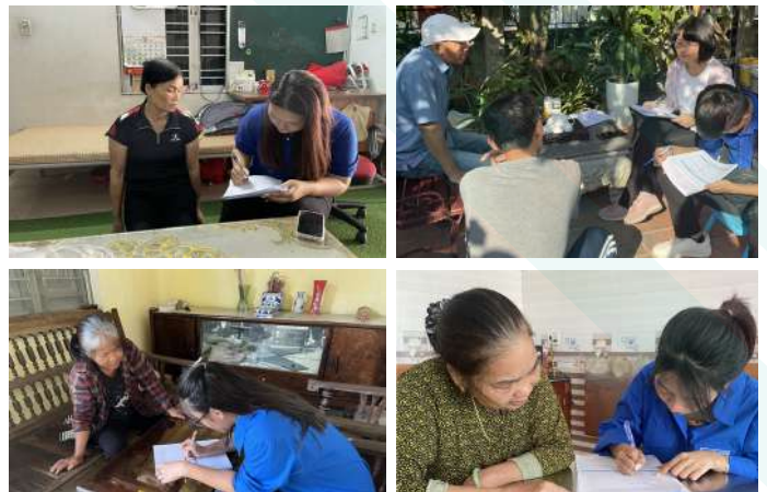
Hoạt động Khảo sát KAP với 205 hộ gia đình