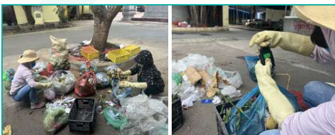
Kiểm đếm rác tại chợ

Rác thải tại các nguồn chính bao gồm: hộ gia đình; các cơ quan trên địa bàn như Ủy ban Nhân dân xã, Trạm xá; chợ; trường học và ga rác được tiến hành kiểm đếm liên tục trong 03 ngày bao gồm cả ngày cuối tuần với hộ gia đình và ga rác để xác định lượng rác thải và thành phần của từng loại rác theo khối lượng và thể tích. Đây chính là cơ sở để tìm hiểu thói quen sinh hoạt của người dân địa phương, xác định các loại rác chính và tìm kiếm các giải pháp quản lý và xử lý rác hiệu quả.