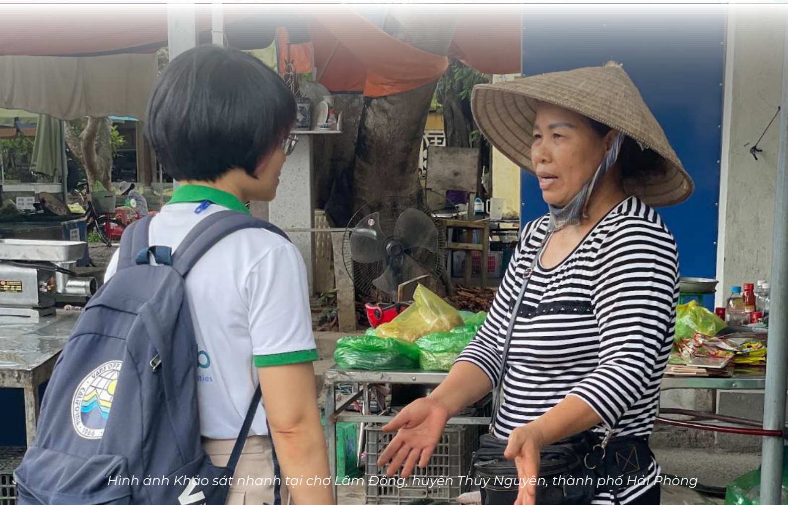
Hình ảnh Khảo sát nhanh tại chợ Lâm Động, huyện Thủy Nguyên, thành phố Hải Phòng